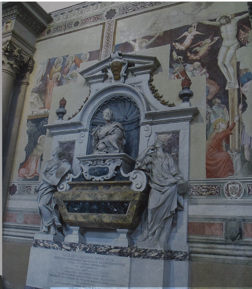
TOMBEAU DE GALILÉE.

Florence regorge tellement de sites artistiques plus fascinants les uns que les autres, qu'il est pratiquement impossible de les visiter en une seule fois. On mentionnera à titre d'exemple, la magnifique église de San Lorenzo , célèbre surtout pour abriter les tombeaux des Médicis sculptés par Michel-Ange, ces ateliers de mosaïques